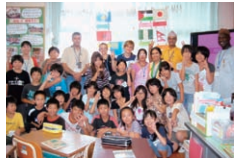
▲小学校の子ども達と

加えて、一般市民の方との国際交流も兼ねた視察プログラムがありました。中でも、各国情報やジェンダー問題とその課題解決のためにアクションプランをまとめた、市民向けのカンントリーレポート発表会や、北九州市内の保育園や小学校での子どもたちとの触れ合いは、ジェンダー主流化に必要な知識とスキルを学ぶと同時に、文化や言葉の違いを超えた、素晴らしい国際交流でした。