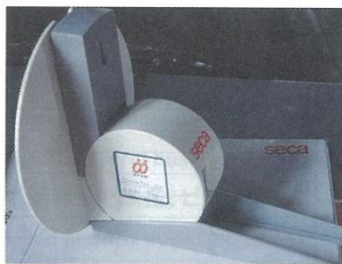
KFAWのステッカーを貼付した現地購入の身長計