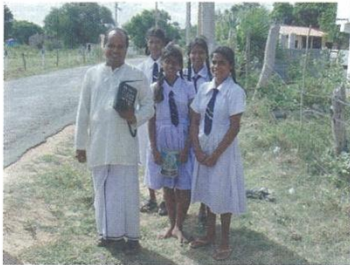
こどもたちと牧師