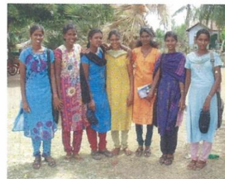
調査協力ボランティア