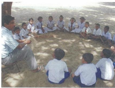
校舎損壊の中学校の授業風景