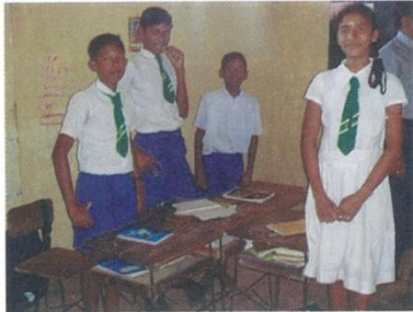
同クラス内でも体格の格差の大きい児童たち