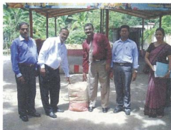
研究協力の中学校の校長と教員たち