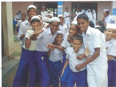
イスラム式学校の男児たち