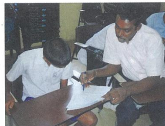
ジェンダーに配慮した担当教師による質問調査