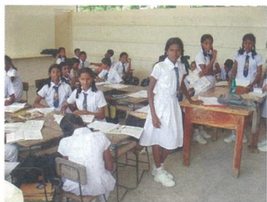
校舎のある中学校の教室内の風景