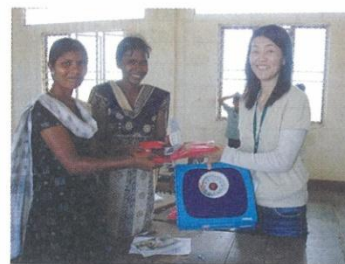
現地購入の体重計の贈呈