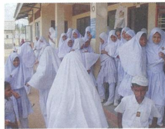
イスラム式学校の女児たち