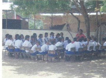
校舎損壊の中学校の授業風景