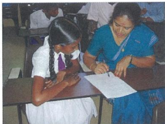
ジェンダーに配慮した担当教師による質問調査