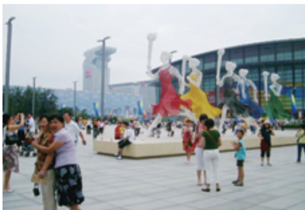
▲「より速く、より高く、より強く」のオリンピック精神を表すモニュメント

2008年8月、中国が「百年の夢」と銘打つ北京オリンピックが開催され、世界のアスリートたちの熱戦が繰り広げられました。幸運にもこの期間、北京の住民の1人として私もビッグイベントのもたらす高揚感に浸ることができました。街中、一斉に色鮮やかなポスターや横断幕が掲げられ、気分はいや応なく高まります。仕事場では誰しもそわそわし、帰宅するとテレビにかじりついて深夜まで試合の動向を入念にチェック、翌朝は同僚たちとあれやこれやの熱い議論です。