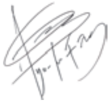
ギタリスト、音楽家 クロード・チアリ