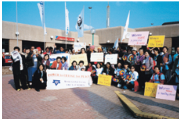
▲ヨハネスブルグ・サミットにて

その後、1995年の北京女性会議、1996年の日米環境女性会議、2000年のアジア太平洋環境女性会議、同年のニューヨークでのグローバル・フェミニスト・シンポジウム、2002年のヨハネスブルグ・サミットNGOフォーラムなどそのすべてに市民と共に参加し、環境・開発・ジェンダーをテーマにワークショップを開催してきました。中でもヨハネスブルグ・サミットには、日本政府代表団顧問に女性グループを代表して参加し、KFAWは環境とジェンダーに関する世界的NGO活動の一翼を担うようになりました。