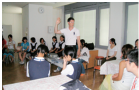
▲米国における男女の違いについてのお話の様子

最後に、バルヴァンズさんから、米国における男性と女性の違いについてのお話がありました。米国では、仕事をする上で男性も女性も平等であり、性別にかかわらず職業を選ぶことができます。また、日本ではまだまだ女性が主に担うことが多い子育ても、それぞれの職場が理解を示し、男女が協力して平等に行っています。しかし、広い国土を持ち、さまざまな国の出身の人たちが暮らす米国では、それぞれの地域性や宗教、人種などによっては、女性に対して保守的な考え方をする人たちもいるのが実情です。そのような状況であっても、これまでも女性たちは行動することで権利を得てきました。最近では、個人の責任意識が薄くなりつつありますが、自分たちの言動にしっかりと責任を持ち、行動し続けていくことが重要とのことでした。