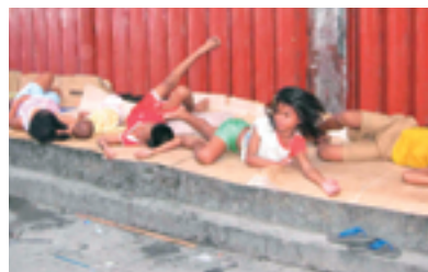
◀路上生活をする子どもたち

食料を配り終えて、私たちはオディンの家に戻りましたが、私は複雑な気持ちになりました。ストリートチルドレンにとっては、経済や政府の動きも、シャツとズボンが合っているかどうかもどうでもいいことで、その関心はただ単に生き延びることだけにあります。21世紀の現代において、人類はあらゆる面で進歩を遂げていますが、飢餓と貧困の撲滅は、いまだに達成していません。路上生活をする子どもたちを含め、すべての貧困者を現実に救う解決策を見出すことを阻んでいるのは、人類の強欲さと腐敗だと私は考えています。