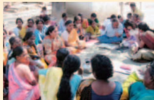
▲カルニ村でのグループ・ディスカッション