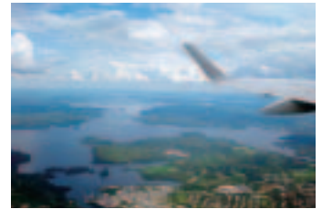
▲空から見たフィンランドの大自然

ところで先進的な政策や職場環境の一方で興味深いのは、男女格差の問題が、職種や給与の偏りという形で依然として存在することである。上記の女性比率の高い職種からも分かるよ