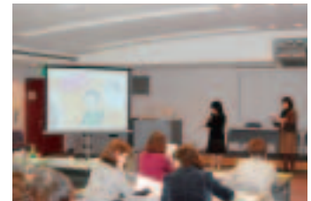
▲受講生による模擬授業

当財団としては、受講生を対象にフォローアップの研修を行うとともに、今後、養成した人材を必要に応じて学校や市民センターなどに派遣できるような仕組みについても検討していく予定です。