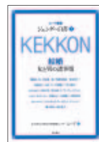
▲シンポジウム登壇者の論文を収めている『ムーブ叢書 ジェンダー白書KEKKON』

■各パネリストの報告資料は、当財団ホームページ http://www.kfaw.or.jp/report/cat20/2011122.html よりダウンロードできます。