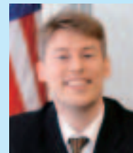
在福岡アメリカ領事館広報担当領事 マイケル・チャドウィック

2011年3月、現オバマ政権のジェンダー平等に対する政策や、アメリカにおける傾向と課題が、わかりやすくまとめられたレポートが発表されました。