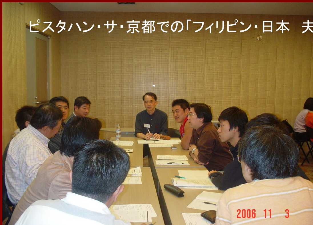
ピスタハン・サ・京都での「フィリピン・日本 夫婦家族セッション」