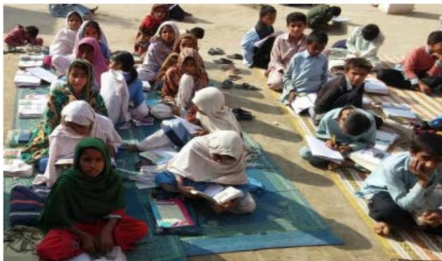
公立小学校で地面に座って本を読む村の子どもたち ( http://elections.alifailan.ptextbooks-the-real-culprit/ )

2018 年 8 月、パキスタンの正義運動党 (PTI) が選挙で政権を取り、そのマニフェストの中で大幅な教育システムの改革を約束しました。PTI は、女子校のレベル向上、小中高の学校の増築、女子への毎年の奨学金の支給、技術機器の供与、士官学校の設定、交通機関の整備、職業訓練や特別教育センターおよびその他の設備の整備を行う予定です。この前進は、都市や農村も含む全国の子供たちにとって、明るい未来への希望を与えてくれるでしょう。