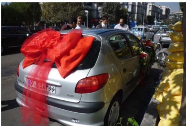
結婚式に向かう車

公益財団法人 アジヤ女性交流・研究フォーラム KFAW KITAKYUSHU FORUM ON ASIAN WOMEN