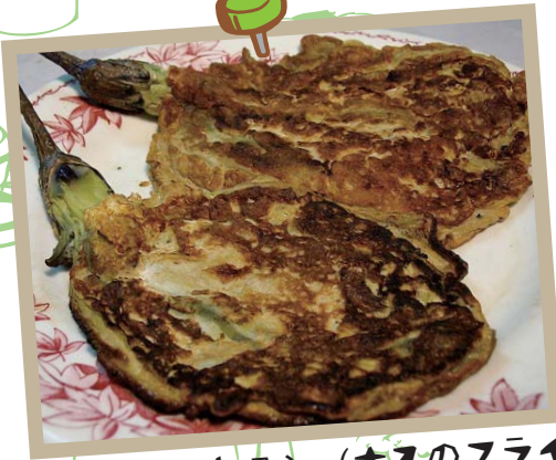
トルタン・タロン (ナスのフライ)