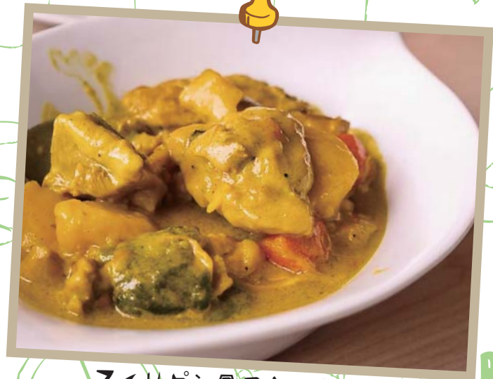
フィリピン風チキンカレー