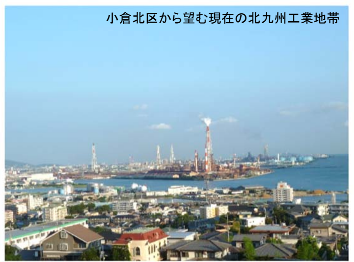
小倉北区から望む現在の北九州工業地帯

公益財団法人 アジア女性交流・研究フォーラム KFAW KITAKYUSHU FORUM ON ASIAN WOMEN お申し込み(調査・研究ライン/西岡)