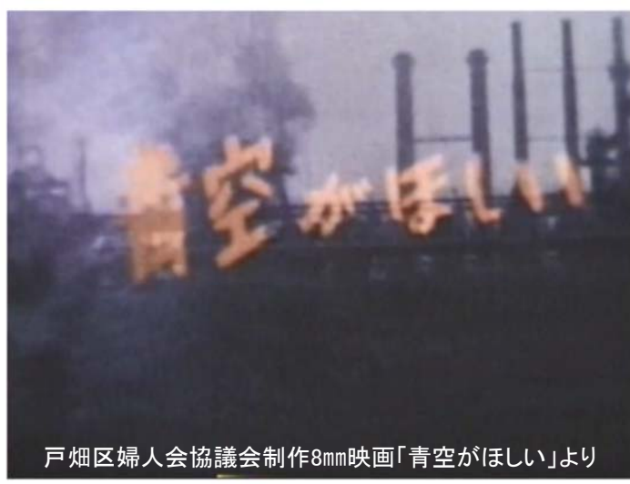
戸畑区婦人会協議会制作8mm映画「青空がほしい」より