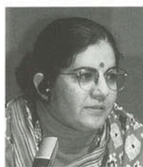
ヴァンダナ・シヴァ