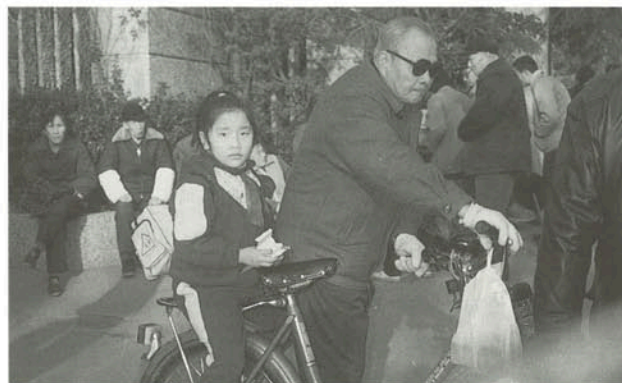
▲孫を小学校へ迎えに来る祖父母たち (中国)

つい最近、私が同僚の家を訪ねたときにこんな話を聞きました。「私は小学校3年生の娘が独りで学校から帰ることに心配なんです。だから毎日学校へ迎えに行くのです」。