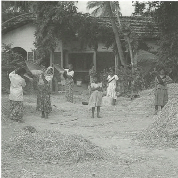
▲家族総出で取入れを行うクルネガラの農家の人たち（スリランカ）