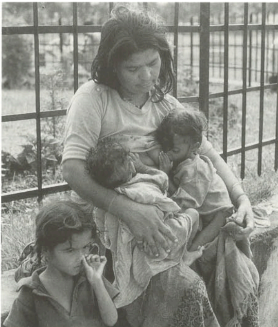
▲ネパールの女性は平均6人の子供を生む

16歳までに、女の子たちはたいてい結婚しますが、それまでに家事の仕方を全部覚えなければなりません。男の子は神の恵みとして、将来家名を継ぐ者として見なされますが、独身の娘は両親にとって重荷でさえあるため、なるべく早く結婚させ、外に出そうとします。女性がどんなに大きく貢献しようとも、男性が生計の担い手と見なされるのです。